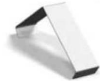
blacha łącząca (do podłożenia) dla kalenicy Carisma