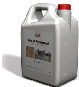
Benders Tak & Markrent

pikemaks ajaks. Katusematerjale müüvatel ja hooldavatel ettevõtetel on pakkuda erinevaid hooldusvahendeid, nii katuse pesuks kui ka samblike tekkimise ennetamiseks.