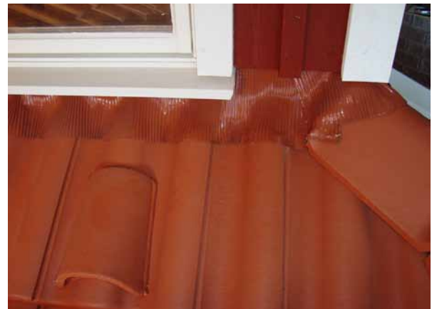
Pilt 2: Paigaldatud seinaliidete tihenduslint. Pildil näha ka tuulutuskivi, vaadake teksti.