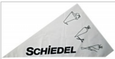
15. 950031680 Tulekindel liimsegu RAPID 310ml