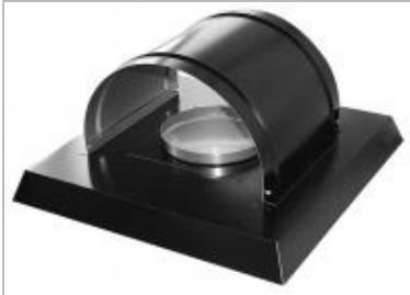
12. 950005503 Vihmamütsi kinnitused, 4 tk pakis