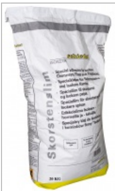
14. 950000310 Liimsegu paigalduskott