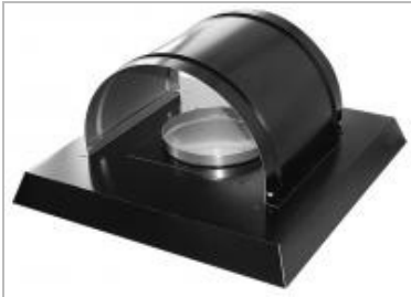
12. 950005503 Vihmamütsi kinnitused, 4 tk pakis