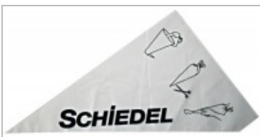
15. 950031680 Tulekindel liimsegu RAPID 310ml