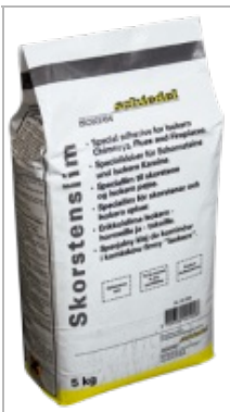
14. 950000310 Liimsegu paigalduskott