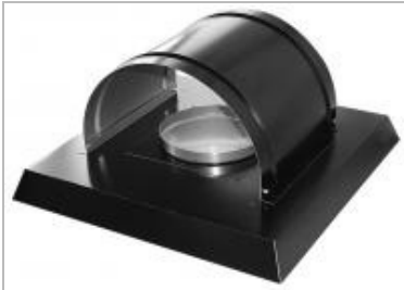
12. 950005503 Vihmamütsi kinnitused, 4 tk pakis