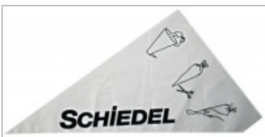
15. 950031680 Tulekindel liimsegu RAPID 310ml