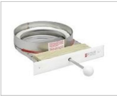
11. 917365371 Vihmamüts must Ø20