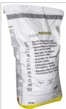
14. 950000310 Liimsegu paigalduskott