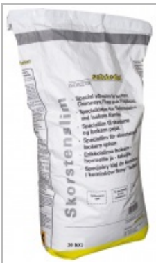
13. 950000310 Liimsegu paigalduskott