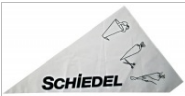
14. 950031680 Tulekindel liimsegu RAPID 310ml